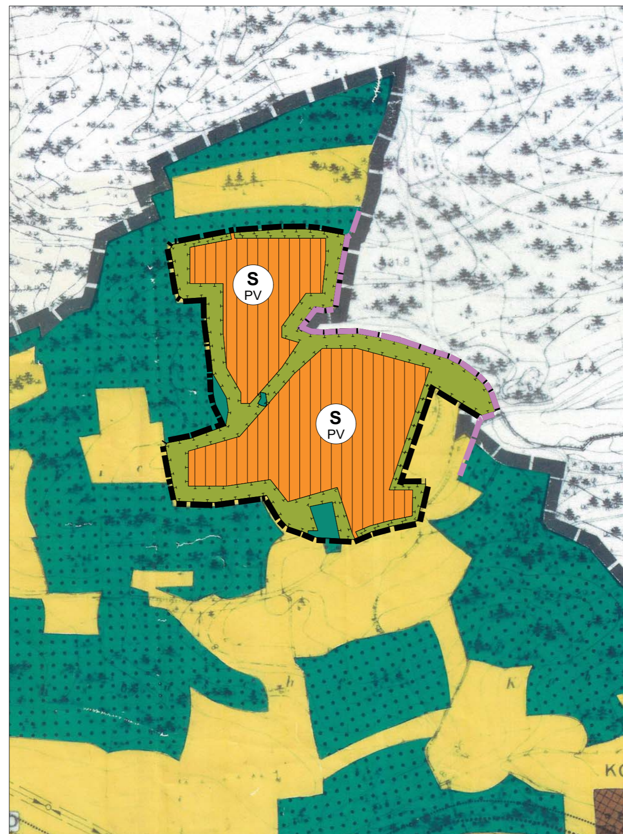
Kartengrundlage: Flächennutzungsplan (Scan)