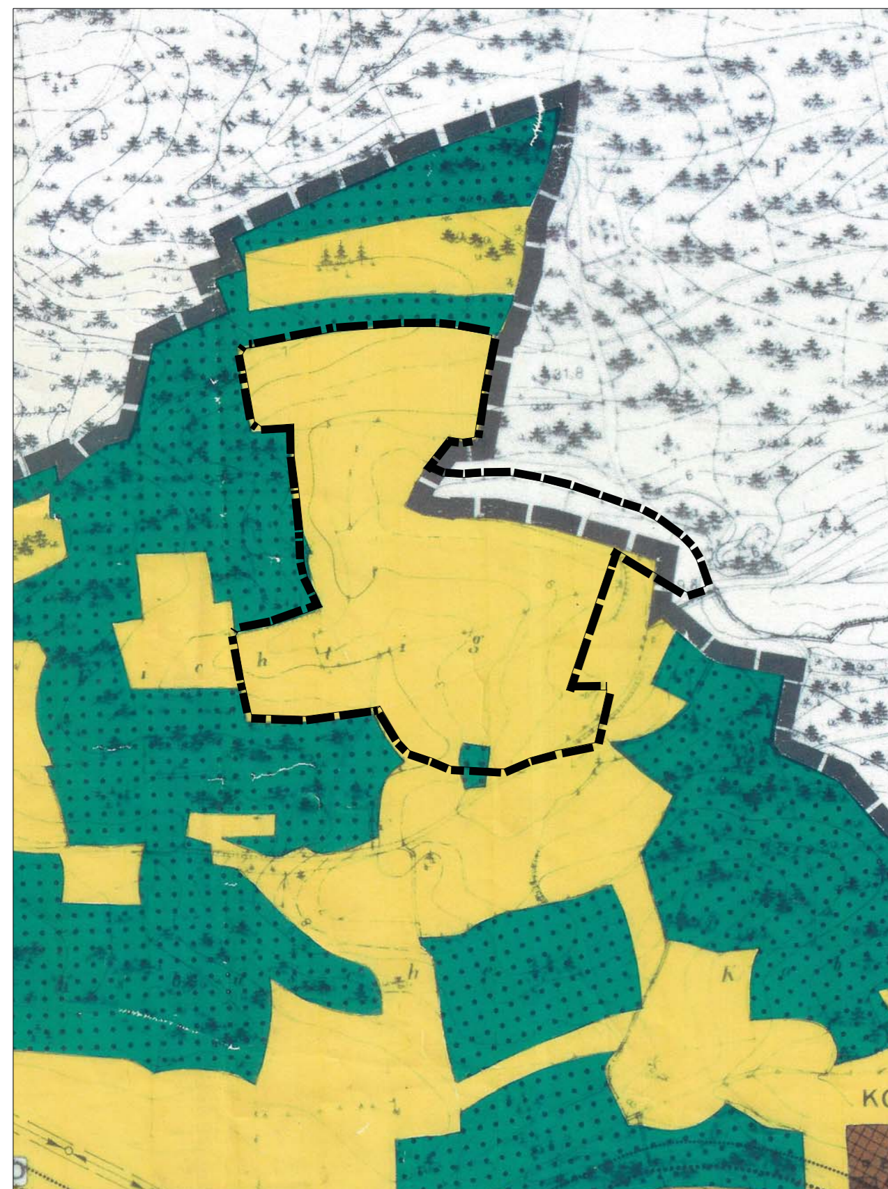
Kartengrundlage: Flächennutzungsplan (Scan)